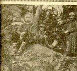
HEROYES DONOSTIARRAS DEL TERCIO DE ORLEMANS, EN UNA POSICIÓN AVANZADA DEL FRENTE DE MONDRAGON

ESPAÑOLES! La Comunidad Tradicionalista os pide una oración por sus Mártires.