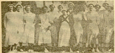
GRUPO DE SEÑORITAS ENFERMERAS QUE PRESTARÁN SUS CRISTIANOS SERVICIOS EN EL SANATORIO DE NTRA. SRA. DE LOS DOLORS CREADO POR LA DELEGACION SANITARIA DE LA JUNTA CARLISTA DE GUERRA DE GUÍPEZZO