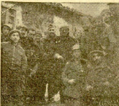
EL VEINTE COBONEL BARRIO. EN EL FRENTE GUIPUZCOANO, BODEADO DE UN GRUPO DE REQUETES DEL TERCIO DE ORLEMANS