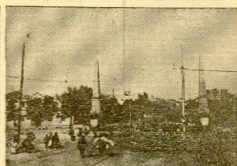
LOS ROJOS SE FORTIFICAN. A LA ENTRADA DEL PUNTE DE TOLDO, HAN FORMADO UNOS DIVERTIDOS PARAPETOS DE ABUQUINES, CON LOS QUE, POR LO VISTO, VAN A PRETENDER FRENAR NUESTRO AVANCE

Durante el día han continuado las hostilidades en las zonas de Jarama, Manzanares, Guadarrama, Guadalupe, y en las inmediaciones de Alcala de Henares, continuando evolucionando al material que desde por la última vez con aún se queda espalla. Esta situación se basa con grandes dificultades. Nuestra aviación y aviación nacionalista constituyen los movimientos