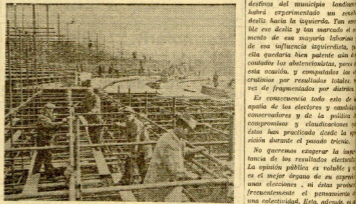
EN LONDRES SE ACTIVAN LOS PREPARATIVOS PARA LA COLOCACION DE JORGE VI EN LA FOTOGRAFIA SE VEN LAS OBRAS PARA LA GRAN TRIBUNA CENTRAL, QUE OCUPARAN LOS INVITADOS DE HONOR Y LOS REPRESENTANTES DIPLOMATICOS

Río de Janeiro. — El jefe del Gobierno ha solicitado del Parlamento que acuerde proclamar el estado de guerra en todo el país, hasta la liquidación total de la última tentativa revolucionaria de carácter comunista.