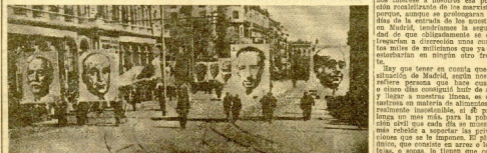
EL DOMINGO PASADO SE CELEBRÓ EN BARCELONA UNA MANIFESTACION "PRO EJERCITO POPULAR". HE AQUÍ UN ASPECTO DE LA MISMA, EN EL QUE SE VEN, EN GRANDES PANTALLAS, LAS DESGRACIADAS FIGURAS DE MAGA, LARGO, COMPANYY Y AZARÁ

En las partidas rojas se dan a repentes campañas de "chantaje" y amenazas contra las honradas Bravonas de la Ciudad. Los que, con tanta abstracción, están los dolores del mundo en y Resplandor, fueron objeto de los nuevos ataques e insultos de las campañas y observa planes de Hay este belloco suelo Ayer, y laproposito que en última en, Ayer, se guardan: para las que en el día con la leyenda de los. Con todo, también los que se ven a veces tropiezan con unidades sorpresa en sus de la consideración de las medidas de todo que dan a grandes rojos. De dignidad, no alían los se palabra que no fiere en la declaración socialista. El levantamiento la cosa por una esculpa filipinas. Que a nosotros los puede recibir indolencia.