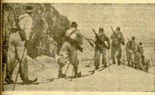
UNA PATRULLA DE ALPINITAS DE LAS FUERZAS NACIONALES. EN MARCHA A TRAYES DE SIERRA. EVADIDA EN PERSECUCION DE LAS BANDAS DE MARXISTAS

La creación del patrimonio familiar será realizado por la adecuación del cultivador a la tierra, sin incorporaciones de siervo. El Jefe del Estado, Generalísimo FRANCO