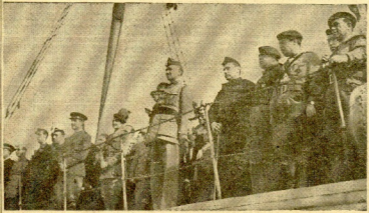
EL GENERAL QUEIPO DE LIANO, EN COMPANIA DE LAS AUTORIDADES, EN LA CUBIERTA DEL "CANOVAL DEL CASTILLO", DESPUES DE LA MISA QUE SE CELEBRÓ EN SUFRAGIO DE LOS MARTIRES QUE EN MALAGA CAUSÓ LA BESTIA MARXISTA