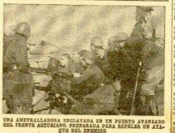
UNA AMETRALLADORA ENGLAVADA EN UN PUERTO AVANZADO DEL FRENTE ASTURIANO. PREPARADA PARA REPELER UN ATAQUE DEL ENEMIGO

En la ceremonia de presentación de las cartas credenciales del embajador italiano, se dio un discurso del representante del Emperador italiano y contestación del Generalísimo.