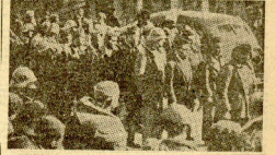
PRISIONEROS COGIDOS A LOS ROJOS EN LAS ÚLTIMAS OPERACIONES DEL FRENTE MALAGUEÑO

Los marxistas huyen por la carretera de Almería. - Al menor movimiento ofensivo de nuestras fuerzas, la capital malagueña quedará totalmente cercada