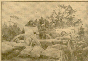
AIRE AFILADO DE SERRANÍA Y REVUELO FURDO DE CAPOTES. SE APREN LAS RUEDAS SILENCIOSAS EN LA ARENA Y LOS CARONES VIGILAN UN HORIZONTE ROJIZO