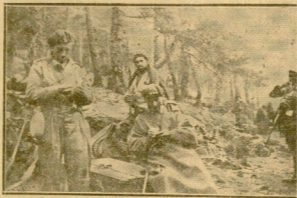
SE CESADO EL FUEGO. UN MOMENTO DE DESCANSO EN LAS TRINCHERAS. USOS FUMAR, OTROS RIRN Y FALSAN Y EL PELIGRO ESTA PROXIMO Y LEJANO

lida impulsar el mundo en su desarrollo. Por un lado las ideas democráticas, con su representación por sufrágio, la idea de voluntad del pueblo, las libertades en toda la superación del individuo sobre el Estado. El hacer del ciudadano un Dios, ideas todas que aun viven en varios Estados y tienen su defensa en las instituciones parlamentarias. Ideas que están degradadas en el comunismo o en las democracias de papelillo y mata, en las democracias ahorradas de billos y millones revolucionarias. De desorden y ruina. Muerte cercana y palpable ya la temoran en Francia, por no ir más lejos, que a los pocos meses de frente popular se sienta reconqu-