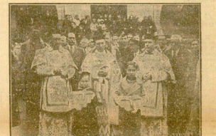
LA COMITIVA DIRIGIENDOSE A COLOCAR EL CRUCIFIJO EN LAS ESCUELAS VITORY

Una niña y un niño, lucieron vestuario azulvivo el año y después de bendecir el Crucifijo, fué colocado en el lugar más pre-