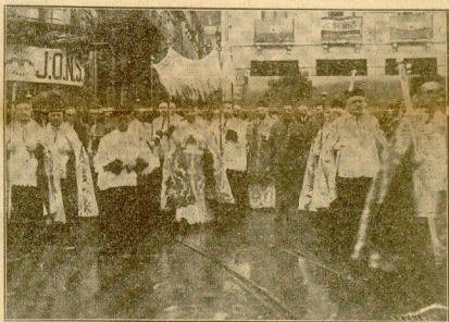
PARA VOLVER A COLGAR EL CRUCIFIXO EN LAS ESCUELAS, PARA QUE DE NUEVO ILLUMEN LAS MENTES INFANTILES; LA IMAGEN DEL CRUCIFIXADO, RECORRIÓ EL DOMINGO LAS CALLES DE SAN SEBASTIÁN EN PROCESION SOLENNE DONDE TODO EL PUEBLO DON-STIARRA DEMOSTRO, UNA VEE MAS, SU DEVOCION Y SU ACENDRADA RELIGIOSIDAD

Unos son débiles; los tres tienen también sus derechos. Hay que lograr, cueste lo que cueste, que los tres se hallen en perfecta armonía. Nada de luchas de clases. Sólo cordia, para obtener el bien común.