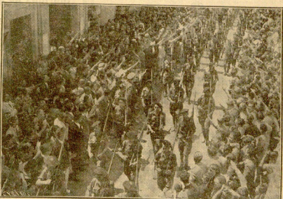
LOS REQUETES DE VILLANOS DESTILANDO ANTE EL GLORIOSO GENERAL