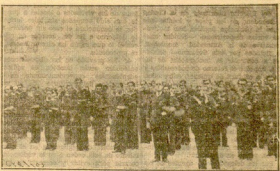
LAS TRIPULACIONES DE LOS BUQUES SUYOS EN EL PUERTO ASISTEN AL SANTO SACRIFICIO

El público, en el que había representaciones de la fuerza armada, y en suar prefere las autoridades del puerto, ex-