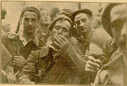
LAS NIÑERAS CARAS QUE NOS ENCONTRAMOS EN SAN MARCIAL. -> ¡¡¡¡¡! ¡¡¡¡¡! ¡¡¡¡¡! ¡¡¡¡¡! ¡¡¡¡¡!