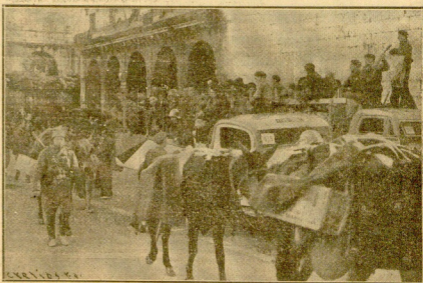
ANACRONISMO DEL MULO Y EL CAMION: EL CONVOY PARTE

Vamos llegando a la cumbre. Un cañonero nos lo avisa. Otro nos lo confirma. El cañonero es ya constante. Y con él, zumbando en los aires, entramos en la posición. Una ermita. Unos cuarteles y unas trincheras. Y unos cuarteles detrás... Seguimos adelante. Saludamos a unos, ofendemos, y charlamos con los mutilos. Nos van indicando la situación. Entramos en lo que fué iglesia de Arrate.