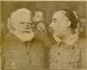
EL GENERAL CABAÑELLAS Y EL NUEVO JEFE DE ESTADO, DESPUÉS DE LA CEREMONIA DE TRANSMISIÓN DE PODERES.

Art. 2.º.—El Presidente de esta Junta resultará directamente los asuntos de cada Comisión; presidirá las reuniones parciales o totales de las mismas y realizará la colaboración de éstas con carácter meramente consultivo.