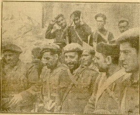
LOS HEROICOS GUARDIAS CIVILES QUE PERMANECIERON EN EL ALCAZAR DURANTE DOS MESES LUCHANDO, A SALIR AL SOL DE LA LIBERTAD SE TOCARON CON LAS ROJINAS ROJAS DE LOS REQUETES QUE HAN IDO A SALVARLES