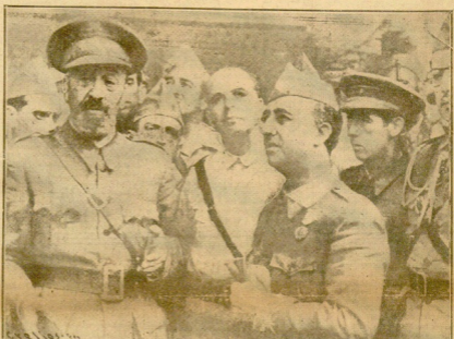
MOSCARDO--HEROES INVICTO CAUDILLO DE LAS FUERZAS QUE RESISTIERON--HABLA CON FRANGO--HEROES TAMBIEN Y TAMBIEN INVICTO CAUDILLO. QUE SE GUIARON A LAS FUERZAS QUE LLEGARON UNO Y OTRO--LA RESISTENCIA INVENCIBLE Y EL EMPUJE ABOLUCION--SON SÍMBOLOS DE LA NUEVA ESPAÑA

Se cumplió con su deber y los suyos las cumplirán también con su deber después, porque de la vida por el deber. España hablará de derechos, sobre los deberes. E. E. (de "El Diario de Navarra").