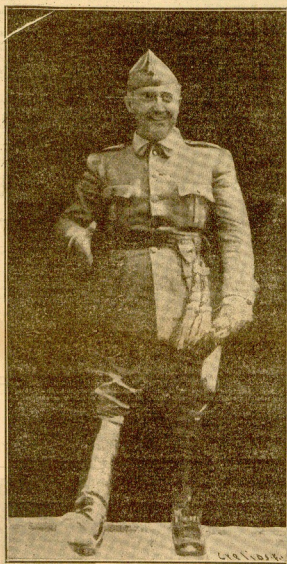
Decreto número 138.

La Junta de Defensa Nacional, creada por decreto de 24 de Julio de 1936 y en régimen provisional de mandos combinados, responde a las más apremiantes ne- cesidades de la liberación de España.