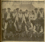
Grupo de danzas Goizaldi en el primer «Eisteddfod» (festival) Internacional Industrial de Ees-Side. En la foto: el grupo de danzas Goizaldi, de San Sebastián, durante el festival de este año. Este grupo, cuando se presentó en el primer «Eisteddfod» de Ees-Side, en 1965, obtuvo el primer premio de su categoría.