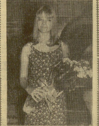
Se celebró ayer con gran brillantez, el día de la Turista, organizado por el Comité de Atracción y Turismo...