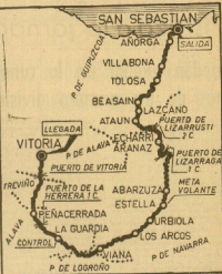
DECIMOSEPTIMA ETAPA-15 MAYO SAN SEBASTIAN-VITORIA-221 K