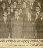
El pasado domingo quedó constituida la nueva Corporación Municipal donostiarra...