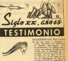
UN BUEN RECORD