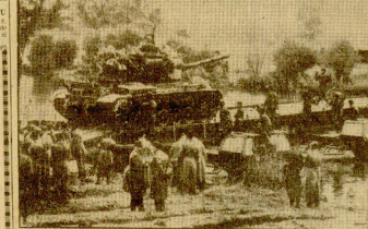
Un tanque ruso en río sobre un puente controla un vehículo alemán...