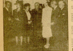
Cubiles en París, después de uno de sus numerosos conciertos en la capital francesa, rodeado de admiradores.

En su opinión, el piano es un instrumento que requiere una gran técnica y una gran sensibilidad. En su opinión, el piano es un instrumento que requiere una gran técnica y una gran sensibilidad.