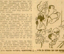
En la última vez que apareció en el mundo.

La caza de las máquinas En su opinión, el piano es un instrumento que requiere una gran técnica y una gran sensibilidad. En su opinión, el piano es un instrumento que requiere una gran técnica y una gran sensibilidad.