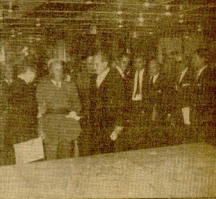
Con asistencia de S. E. el Sr. del Estado, Generalísimo Franco...