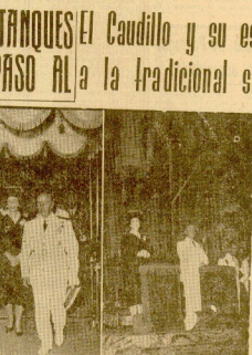
Los heridos de la guerra del Cantabro. Entre y en el grupo a la tradición del salvé de Santa María.

Los soldados de la zona Oeste, con el apoyo de los soldados de la zona Oeste.