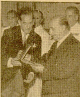
El jefe del Estado británico, el conde de Snowdon, con el jefe del Gobierno británico, el conde de Home, y el jefe del Gobierno francés, el conde de De Gaulle, en un momento de la recepción en el Palacio de la Monnaie.

Los países del área de los seis se proponen hacer lo mismo. La decisión británica acelerará proceso de unión continental.