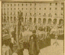
Un extenso funeral de campo precedió al acto de depósito en la tumba de San Carlos de Navarra (VER INFORMACION EN CUARTA PAGINA)

El desfile de la Victoria, que se celebró en un gran estadio de la Victoria, con la asistencia de las XXV Brigadas Militares, el jefe del Estado y Cuartel de España, Gobernador Civil, el Generalísimo Franco y el resto de la familia real, se celebró en un gran estadio de la Victoria, con la asistencia de las XXV Brigadas Militares, el jefe del Estado y Cuartel de España, Gobernador Civil, el Generalísimo Franco y el resto de la familia real.