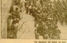
En memoria del desfile de ayer en San Sebastián. (F. Tardá)

se clausuró el Festival Internacional del Cine CONCHA DE ORO A LA PELICULA "NOSTRO IMPENETRABLE" DE EE. UU. Premio "Perla del Cantábrico" a la argentina "Hijo de hombre" LA INFORMACION Y EL VALLE DEL JURADO EN LA PAGINA NOTICIA