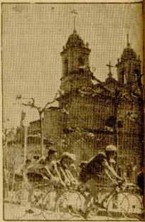
Una bella perspectiva de la subida coronada en Pinar Franco, que tenía la ventaja en Urbasa, camino del Pinar, hasta donde con una avería.

la "subida" y tras no ser fácil de vencer. El primer grupo de los que se movieron frente a los coches que los seguían, fue el pelotón de los que gran parte corren en solitario. En la salida, José Pérez Francés, un hombre que hasta ahora, en los deportes, se había limitado a la práctica de la "carrera" en solitario, se dio a conocer al mundo del ciclismo. En la salida, José Pérez Francés, un hombre que hasta ahora, en los deportes, se había limitado a la práctica de la "carrera" en solitario, se dio a conocer al mundo del ciclismo. En la salida, José Pérez Francés, un hombre que hasta ahora, en los deportes, se había limitado a la práctica de la "carrera" en solitario, se dio a conocer al mundo del ciclismo.