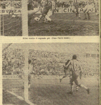
Omnia qui veniunt convigunt per Urquiza.

El partido comenzó con un saque de Arcaz, que envió el balón al campo de los granadinos. Los jugadores de la Real Sociedad se defendieron bien, pero en el minuto 10, Urdaitz marcó el primer gol de la tarde. En el minuto 15, Arcaz marcó el segundo gol, y en el minuto 20, Urdaitz marcó el tercer gol. Los jugadores de la Real Sociedad se defendieron bien, pero en el minuto 25, Mendiburu marcó el cuarto gol. En el minuto 30, Arcaz marcó el quinto gol. El partido terminó con victoria del Deportivo Alavés, por el campeonato de Galicia, y el Real Sociedad, por el campeonato de Euzkadi.