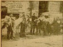
Para las nueve horas de ayer había mucha expectación en el parque madrileño de la visita de la Princesa para festejar a los cinco años de edad de la corte rija de la Escuela de Agronomía, de Madrid, que se dirige a Bélgica para regular sus pautas en la próxima zona.