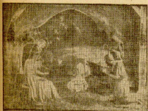
En el belén el nacimiento de Jesús de la virgen de San Juan de Dios.

En la Plaza de San Juan de Dios se ha montado también un belén vascongado, con un escenario que representa un momento de la historia de San Sebastián, concretamente un momento de la guerra civil. Este belén vascongado se ha realizado totalmente en papel.