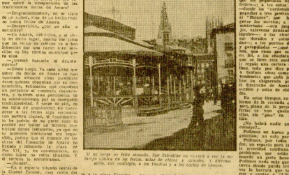
El lugar en que se pensó situar las ferias de Amara, para el mes de mayo y para la feria de octubre y noviembre, ya no existe.

Con amor y todo para mejorar a la mujer. Así como tú, también yo quiero ser una mujer. Así como tú, también yo quiero ser una mujer. Así como tú, también yo quiero ser una mujer. Así como tú, también yo quiero ser una mujer.