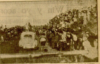
Al estado de gran el Subito el ducho. Entre sus enorme multitud, sostiene un curioso