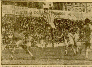
Sampedro ensaya en el estadio de Chamartín con el equipo nacional B que se enfrentará a Alemania.

El partido de fútbol que se celebró en Barcelona terminó con una victoria para Saragateta por el resultado de 7-1.