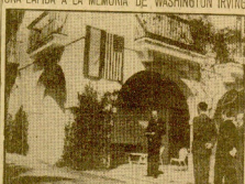
El Entregado de los Estados Unidos, Mr. Lodge, frente al monumento a la memoria del ilustre escritor y periodista Irving. (De Puerto Rico.)