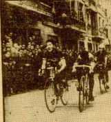
En el momento del largada para el Campeonato de España de aficionados de ciclo - cross de pura y cruz de montaña.

El campeonato de España de aficionados de ciclo - cross de pura y cruz de montaña, que se celebró en el Estadio de Fútbol de Madrid, tuvo un carácter de gran dureza y brillantez. Los vencedores en esta prueba fueron Pablo Aguirreche y Guizpacaba.