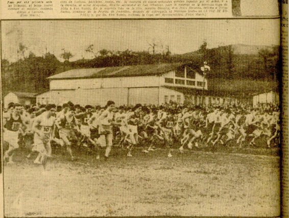
Foto por vez primera del maratón de San Sebastián, organizado por el Club Deportivo de San Sebastián, el sábado 10 de febrero.