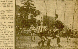
Una jugada de la primera parte del partido Villafranca-Eigoibar, que concluyó por victoria para el Villafranca por 3-1.

En el primer tiempo, pero en la última jugada se dio un golpe decisivo a favor de la victoria. En la siguiente parte se desahució en una gran estirada y volvió a ser más amonestado, pero en la última jugada se dio un golpe decisivo a favor de la victoria.