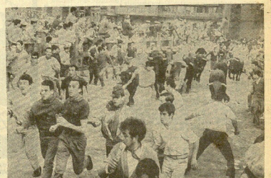
Con gran animación se corrió, en la mañana de ayer, el segundo encierro de los "sanfermines", caracterizado por la gran alfluencia de forasteros. La juventud corrió delante de los toros sin que ocurriera nada por parte de mayor consideración, como ocurría en el primer encierro, donde se registraron dieciséis heridos y uno grave. Entretanto, la famosa vete de fiesta... (Reportajes en la pág. 17.)