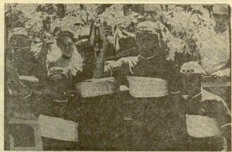
Los corredores castellanos se acercaron del Campesino de España por regiones disputado el domingo en Zaragoza.