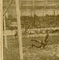
El primer gol, el primer error, el primer saque de fútbol en el partido de hoy.

El partido terminó con un saque de Progreso. Los jugadores de Progreso jugaron con mucha intensidad y lograron marcar tres goles. Los jugadores de Recreación jugaron con menos intensidad y solo lograron marcar un gol.