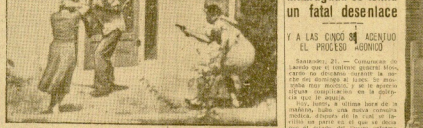
UN POLICIA TUVO QUE MATAR A UN LOCO

LA EXTREMAUCCION A las dos de la madrugada se temía un fatal desenlace