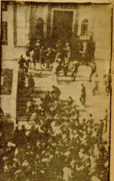
Disturbios en Siria y Egipto

Barcelona, 3. — Más de tres millones de pesetas se han ganado en las quinielas de la semana pasada, según se desprende de los boletines de resultados que se publican cada semana.