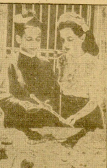
La católica de Isabel la Católica