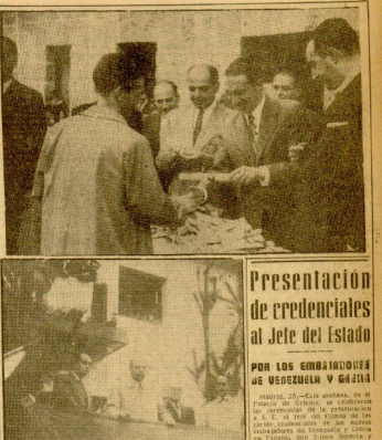
Los fotógrafos de los actos en Egipto y Alexandria, con motivo de la evacuación de las tropas británicas de Suez. En primer plano, el Sr. Farouk, rey de Egipto, y el Sr. Abd el Nasser, primer ministro de Egipto. A la izquierda, el Sr. Abd el Wahab, ministro de Exteriores de Egipto. A la derecha, el Sr. Abd el Wahab, ministro de Exteriores de Egipto.

El acuerdo con Egipto, a punto de ser firmado, se refiere a la evacuación de las tropas británicas de Suez. El acuerdo con Egipto, a punto de ser firmado, se refiere a la evacuación de las tropas británicas de Suez.