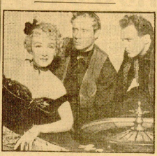
Marlene Dietrich, siempre actual...