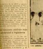
Los caballos de Las Ardenas fueron premiados en el concurso agrícola...