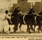
Los caballos de Las Ardenas fueron premiados en el concurso agrícola...