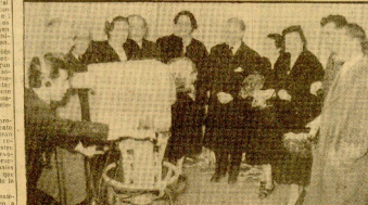
El programa de Radio Nacional... El programa de Radio Nacional...