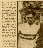
Arriba, el hombre que se... Arriba, el hombre que se...

Por fin quebró el negocio clandestino de "El Seguro de la Lecha"