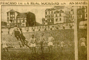
FRACASO DE LA REAL SOCIEDAD EN ANAMÁS

Washington, 7. — El presidente Wilson, en un discurso pronunciado en el momento de su salida para el extranjero, afirmó que seguiría una política exterior coherente y positiva. El presidente Wilson, en un discurso pronunciado en el momento de su salida para el extranjero, afirmó que seguiría una política exterior coherente y positiva.