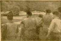
En la mañana de hoy, el pueblo de Orio se encuentra desolado.

El pueblo de Orio, con sus cinco pescadores, se apresuró a salir a la barra de Orio, y se apresuró a salir a la barra de Orio, y se apresuró a salir a la barra de Orio.