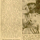
El sultán de Irán, Abdol Illah, en un momento de su visita a España en el momento de su llegada a Madrid.