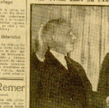
Vac Vizai Juba su cargo de embajador en España.