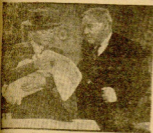
En escena el musical "No estoy sola", con los actores y bailarines de la compañía de teatro musical "El teatro de la calle".