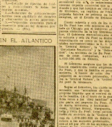
La Esquadra Española en el Atlántico, mostrando la potencia naval de España.