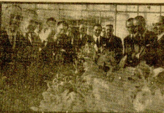
El Ministro de Agricultura, Sr. Fernandez Cuesta, en un momento de su visita a Sevilla.