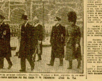
Señal, 15 - El señor...

Señal, 15 - El señor... (Continuation of text from other sections)