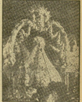
Monseñor Sangua del Clero, Párrafo de San Sebastián, asistiendo a la misa por la Asunción de la Virgen en la catedral de San Sebastián.

En todos los lugares de España hubo manifestaciones religiosas para celebrar el dogma de la Asunción de la Virgen. Se realizaron misas y procesiones en todas las ciudades y pueblos.