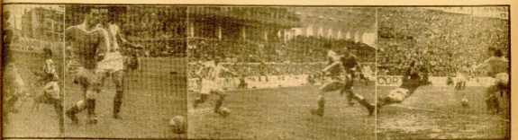
Epigme, con su esposa, en el patio del Hotel... (Caption describing the photo above)