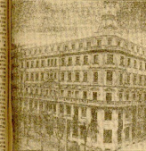
Nuevo edificio del Banco de San Sebastián.