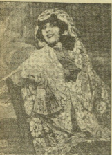
Retrato de Ignacio Zuloaga, por Carlos Rivera.

El más reciente de los retratos de Ignacio Zuloaga, el pintor vasco, es un retrato de un hombre fuerte, de un hombre que ha vivido una vida de lucha y de sacrificio. El retrato es una obra maestra de la pintura española contemporánea. Zuloaga, con su fuerte hombría, ha sido uno de los grandes artistas de su tiempo. Su obra es una muestra de la grandeza del arte español. El retrato de Zuloaga es una obra que merece ser estudiada y admirada. Es una obra que refleja la vida y el espíritu de un hombre que ha dejado una huella profunda en la historia del arte español.