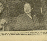
El Rey de Tailandia con su prometida, la princesa Sirikit, en un momento de su boda.