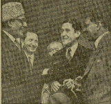
El alto comisionado del Pakistán en España, M. J. Khan, acompañado de miembros de la delegación comercial, en un momento de la recepción en el Ministerio de Asuntos Exteriores.