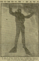
Protesta colectiva del Episcopado español

BRUXELAS. 7. En un momento de gran agitación política, el Episcopado español protesta colectivamente por la condena del Cardenal Mindszenty. El Episcopado español protesta colectivamente por la condena del Cardenal Mindszenty. El Episcopado español protesta colectivamente por la condena del Cardenal Mindszenty.