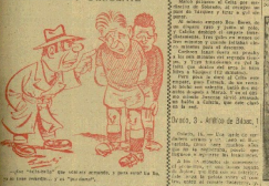
¡Su Sueno pierde por su mal trato a don't zapatos! Se deshace por la cuenta de D